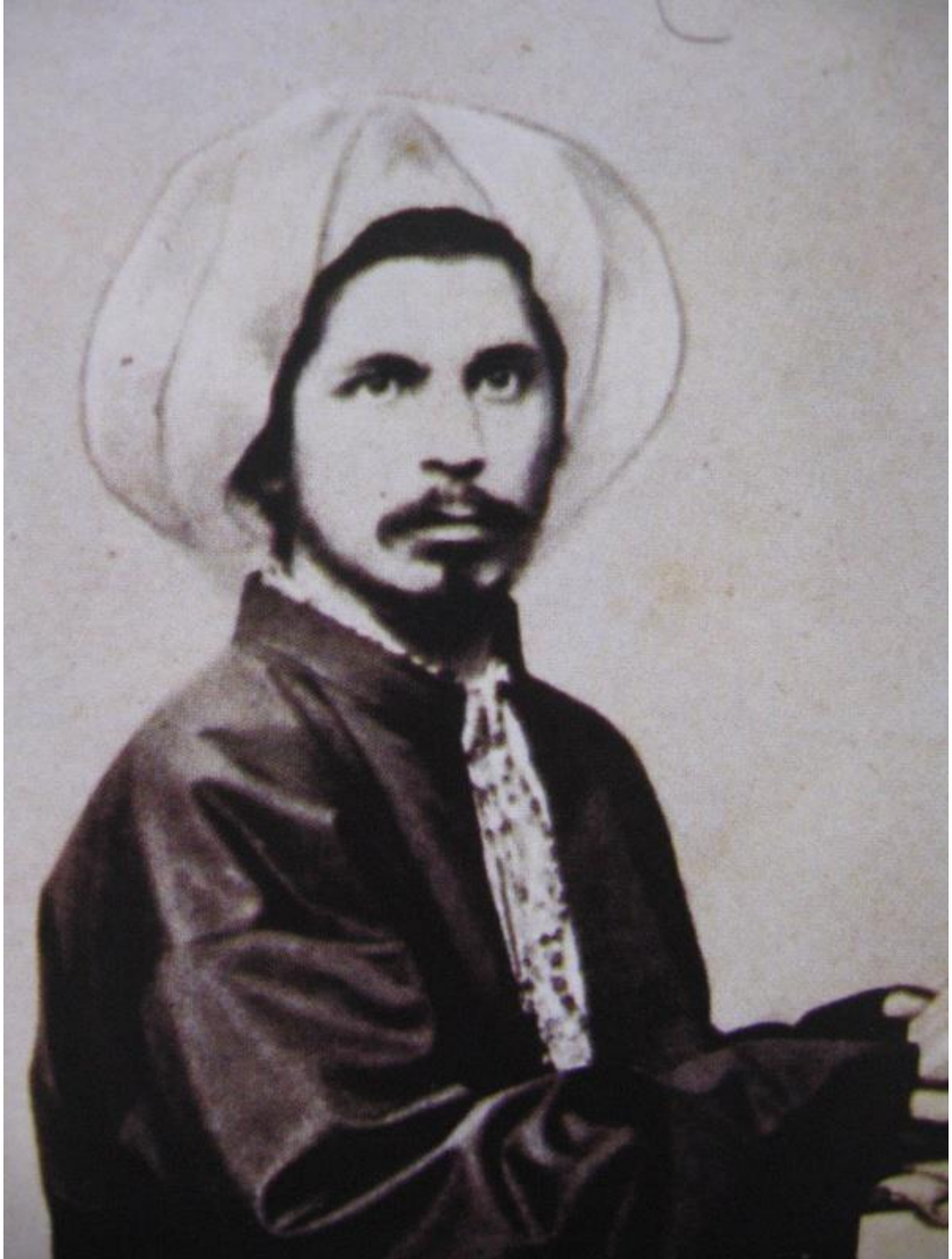
EK 1: ALİ SUAVİ'NİN SARIKLI BİR POTRESİ.