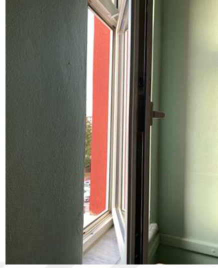
Şekil 5.5 Pencerenin 15 cm' den fazla açılmayacak şekilde getirilmesi