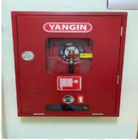
Şekil 5.10 Yangın hortumu ve yangın tüpünün bulunması

Yangın Sistemleri: Çeklist sonucuna göre yangın sistemleri bölümünde 3 evet, 1 hayır, 3 kısmen sonucu elde edilmiştir. L tipi matris metodunda ise 1 yüksek, 2 orta risk grubu tespit edilmiştir.