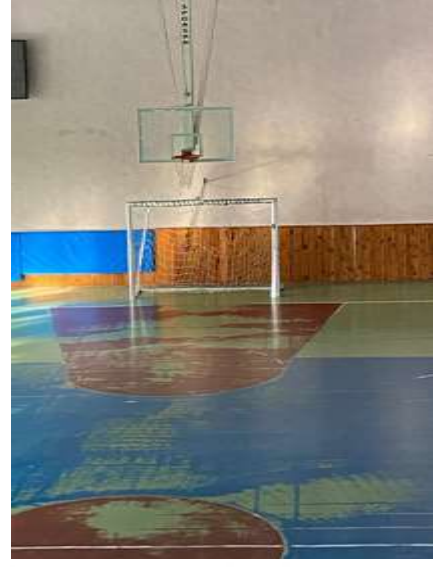
Şekil 5.19 Sabitlenmiş kale direği

Laboratuvar: Çeklist sonucuna göre laboratuvarlar bölümünde 5 evet, 2 hayır sonucu elde edilmiştir. L tipi matris metodunda ise 3 yüksek, 1 orta, 3 düşük risk grubu tespit edilmiştir.