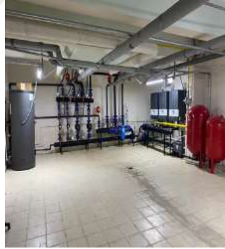
Şekil 5.9 Kazan dairesinde malzeme olmaması

Yüksek risk gaz algılama sensörünün uzakta olması (Şekil 4.8), orta riskler ise acil çıkış ve tehlike uyarı işaretlerinin olmaması ve boru hatları üzerinde işaretleme yapılmamasıdır. Celep (2022)'de vanalar, boru hatları ve pompa üzerinde isimlerinin ve akış yönlerinin olmaması durumunu orta risk olarak hesaplamıştır. Şekil 4.9'da görüldüğü gibi kazan dairesinde malzeme bulunmamaktadır ve düşük risk olarak gösterilmiştir.