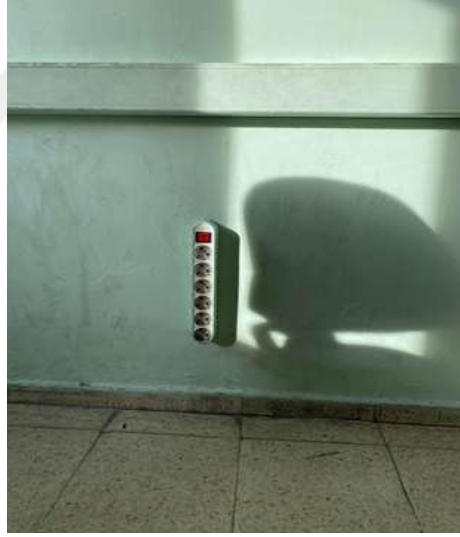
Şekil 5.6 Çoklu priz kullanılması

Bu çalışmada yüksek riskler prizlerde koruma olmaması ve yarı açılır pozisyona getirilmeyen pencere bulunması (Şekil 5.4) şeklindedir. Okulda pencereler yarı açılır pozisyona getirilmiştir (Şekil 5.5) ancak bazı pencerelerde (Şekil 5.4) kopmalar meydana gelmiştir. Orta riskler ise sivri köşelerin bulunması, askılıkların olması ve çoklu prizlerin kullanılması (Şekil 5.6) şeklindedir.