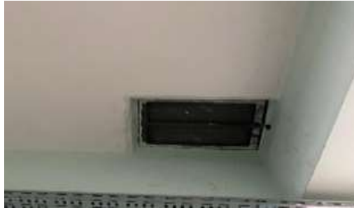
Şekil 5.7 Çatı çıkış kapağının metal olması

Çatı Katı: Çeklist sonucuna göre çatı katı bölümünde herhangi bir risk mevcut değildir, tüm sorulara evet cevabı verilmiştir. L tipi matriste ise 2 düşük risk tespit edilmiştir. Şekil 4.7 de çatı kapağıyla ilgili alınan önlem gösterilmiştir.