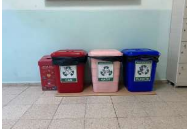
Şekil 5.12 Plastik, cam, kağıt ve pil sıfır atık kutularının bulunması

Kimyasal Maddeler: Çeklist sonucuna göre kimyasal maddeler bölümünde 1 evet, 1 kısmen sonucu elde edilmiştir. L tipi matris metodunda ise 1 orta, 1 düşük risk grubu tespit edilmiştir.