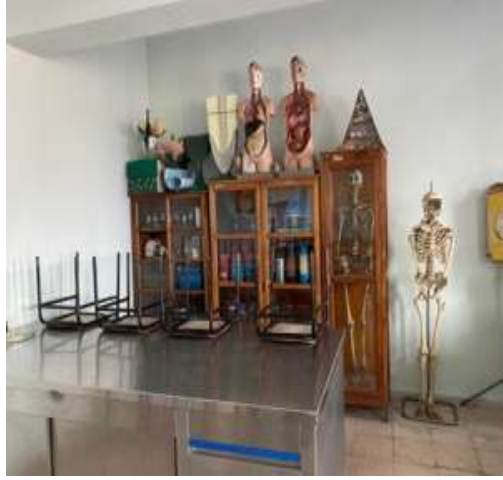
Şekil 5.20 Dolapların üzerinde düşebilecek malzeme olması

Laboratuvar: Çeklist sonucuna göre laboratuvarlar bölümünde 5 evet, 2 hayır sonucu elde edilmiştir. L tipi matris metodunda ise 3 yüksek, 1 orta, 3 düşük risk grubu tespit edilmiştir.