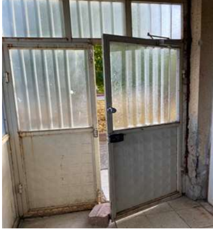
Şekil 5.1 Acil çıkış kapısının içeri doğru açılması