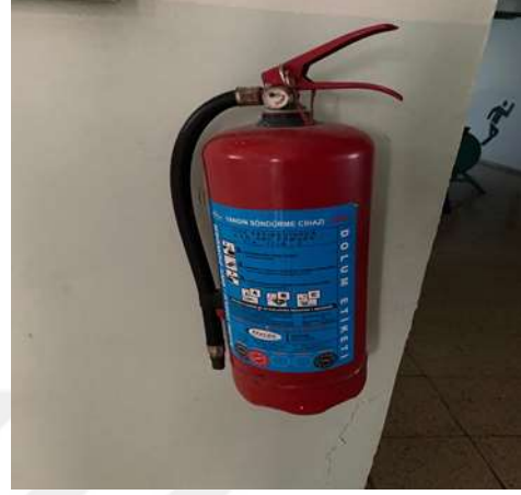
Şekil 5.11 Basıncı düşük yangın tüpü bulunması

Yüksek risk yangın algılama ve uyarı sisteminin olmamasıdır. Orta riskler ise basıncı düşük yangın tüpünün olması (Şekil 5.11) ve bağlantı hatası olan yangın hortumlarının bulunmasıdır. Canoğlu vd. (2023)'nin bir ilkokulda yaptığı çalışmaya göre orta düzeyde riskler yeterli düzeyde yangın söndürme tüpünün olmaması; yangın söndürme sistemlerinin ve duman algılama sistemlerinin periyodik kontrollerinin yapılmaması şeklindedir. Şekil 5.10'da görüldüğü gibi okulda yeterli sayıda yangın tüpü ve yangın hortumu bulunmaktadır.