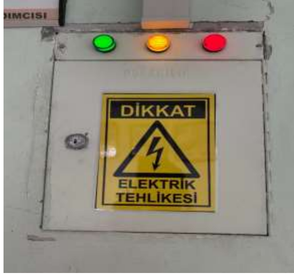
Şekil 5.17 Elektrik panolarında uyarı işareti bulunması

Yüksek riskler elektrik ana panosunun bulunduğu alanda malzeme olması ve panoların kilitli tutulmamasıdır. Tüm panolarda uyarı işaretleri (Şekil 5.17) ve kaçak akım röleleri bulunmaktadır.