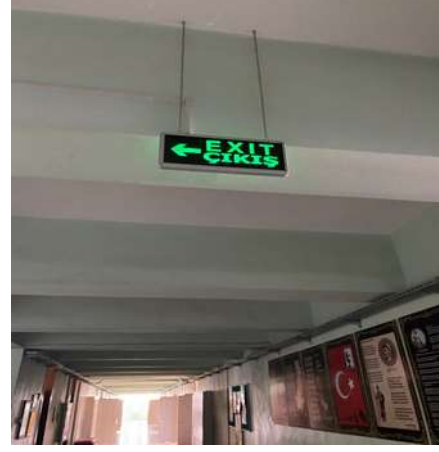
Şekil 5.2 Acil çıkışı gösteren uyarı işaretleri

Bayraktar vd. (2019)'da Kaynaşlı Anadolu Lisesi'nde deprem kaynaklı yapısal olmayan risklerle ilgili yaptığı risk değerlendirmesinde bina çıkış kapılarının yönlerinin dışarı doğru olmamasını yüksek risk olarak tespit etmiştir.