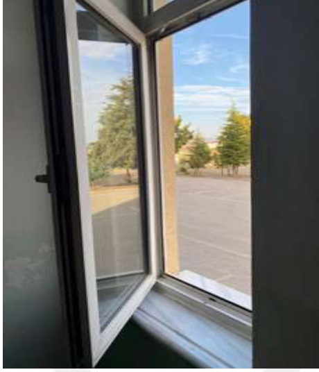
Şekil 5.4 Pencere tam açılmasını önleyen aparatın kopması