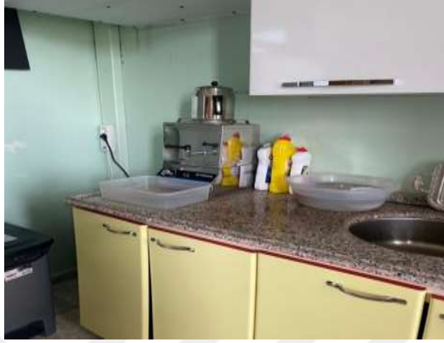
Şekil 5.21 Çay kazanı yanında kimyasalların olması

Çay Ocağı: Çeklist sonucuna göre çay ocağı bölümünde 2 evet, 2 hayır sonucu elde edilmiştir. L tipi matris metodunda ise 1 yüksek, 1 orta risk grubu tespit edilmiştir.