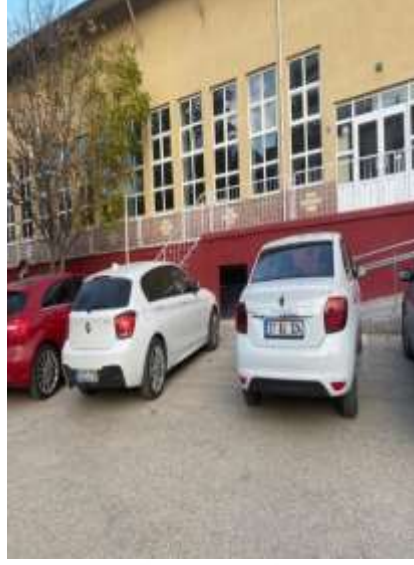
Şekil 5.3 Şekil 4.3 Okul bahçesine araç park edilmesi

Yüksek risk; okul bahçesine araç park edilmesidir (Şekil 5.3). Orta riskler ise pencere ve çatıdan malzeme düşmesi, böcek ve haşerelere karşı ilaçlama yapılmaması, bahçede kademeli kısımların olması ve okul bahçesinin direkt trafiğe açılmasıdır. Celep (2022) tarafından da böcek ve haşerelere yönelik ilaçlama yapılmamış olması, zeminde seviye farklarının bulunması orta dereceli risk olarak belirlenmiştir.