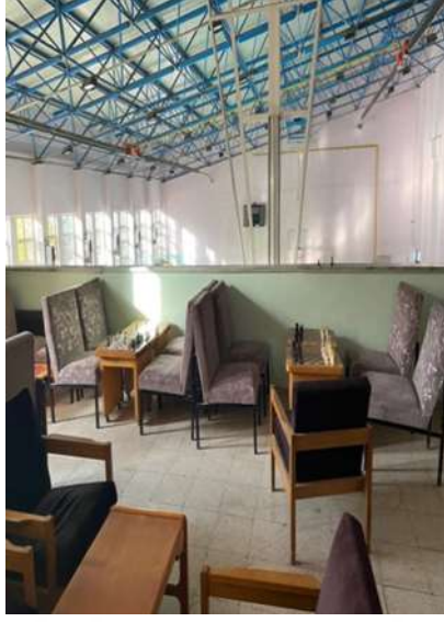
Şekil 5.18 Spor salonu asma katında korkuluk olmaması