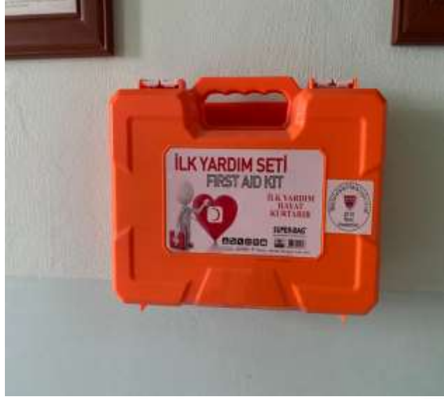
Şekil 5.14 Ecza dolabı bulunması

Yüksek riskler çalışanların ve öğrencilerin sağlık kontrolünden geçmemesidir. Hacıfazlıoğlu (2019) da yaptığı risk değerlendirmesinde çalışanların işe giriş periyodik sağlık muayenelerinin yapılmadığını belirtmiş ve orta risk olarak tespit etmiştir.