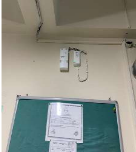
Şekil 5.8 Gaz algılama sensörünün uzakta olması

Kazan Dairesi: Çeklist sonucuna göre kazan dairesi bölümünde 5 evet, 1 hayır, 1 kısmen sonucu elde edilmiştir. L tipi matris metodunda ise 1 yüksek, 3 orta risk grubu tespit edilmiştir.