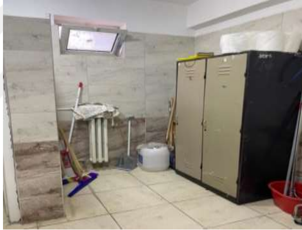
Şekil 5.13 Kimyasalların açıkta olması

Kimyasal Maddeler: Çeklist sonucuna göre kimyasal maddeler bölümünde 1 evet, 1 kısmen sonucu elde edilmiştir. L tipi matris metodunda ise 1 orta, 1 düşük risk grubu tespit edilmiştir.