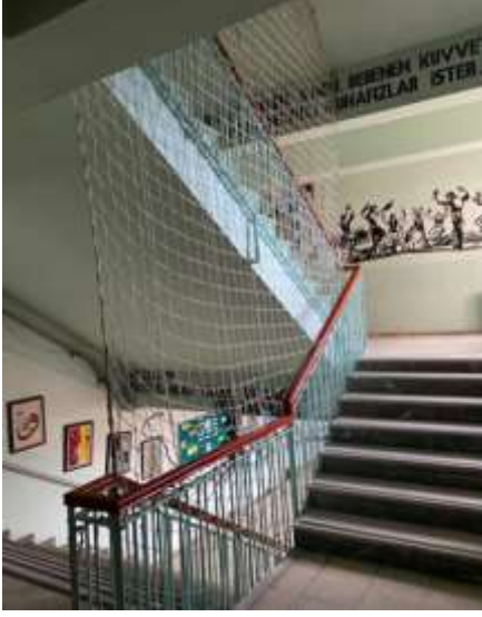
Şekil 5.15 Merdivenlerde güvenlik ağlarının bulunması