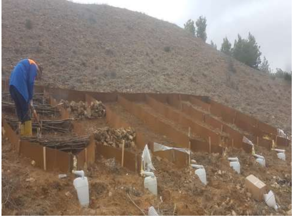
Şekil 3.8. Parsellerden genel görünüm