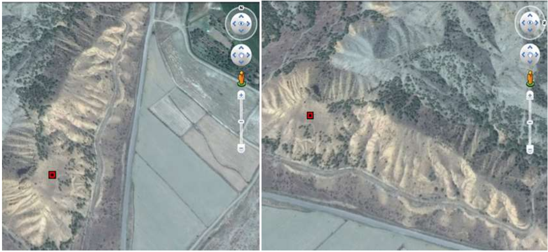
Şekil 3.2. Çalışma alanının görünümü

Parsellerin yerlerinin seçiminde, erozyon durumu, eğim durumu, bakı durumu, yamaç şekli ve durumu ve arazi kullanım durumu kriterleri dikkate alınmıştır. Belirlenen kriterlerden hareketle erozyon sorunu olan, çok dik eğimli, güneşli bakı, açıklık bir alan olmasına dikkat edilmiştir. Ayrıca, parsellerin uygulandığı çalışma alanı olarak düz yamaç özelliğinde bulunan üst yamaçta açıklık alan niteliğinde bir alan (OT) seçilmiştir. Parsellerin kurulduğu üst yamaçtaki alan çok dik eğimli olmakla birlikte ortalama eğimi %80-85 aralığındadır. Alanın genel bakışı batı bakı olup güneşli bakı grubu içerisinde kalmaktadır (Şekil 3.2).