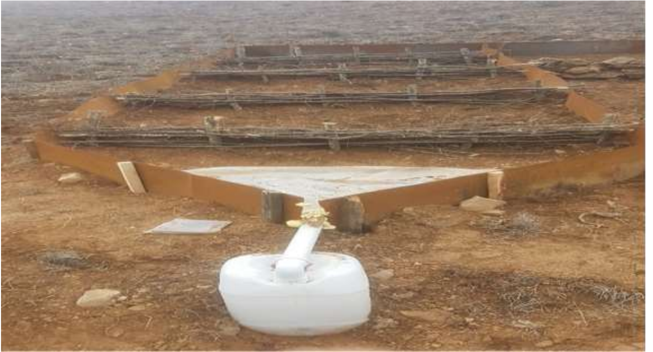
Şekil 3.5. Örne çit parseli