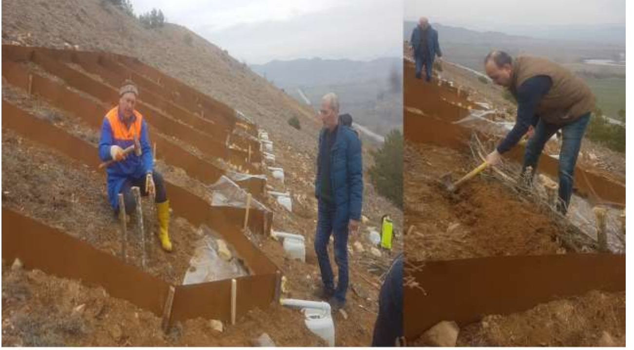
Şekil 3.4. Örne çit yapımı