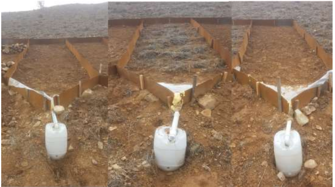
Şekil 3.7. PAM parseli, OT parseli ( orman toprağı ), kontrol parseli