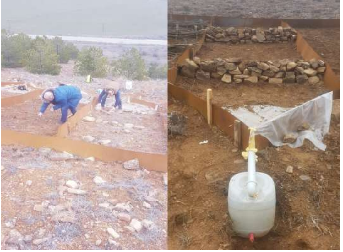
Şekil 3.6. Taş kordon yapımı ve parseli