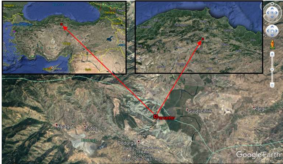
Şekil 3.1. Çalışma alanının konumu

Proje çalışması ülkemizin Karadeniz Bölgesinin Orta Karadeniz Bölümünde yer alan Çorum ili Osmancık ilçesi sınırları içerisinde Dodurga-Güvercinlik mevkiisinde yer almaktadır (Şekil 3.1).