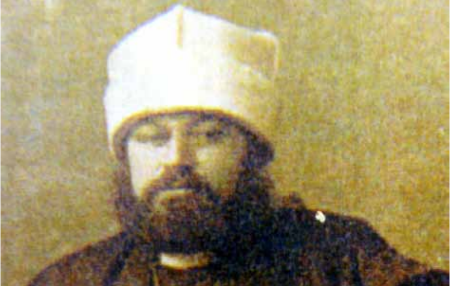
Resim 5. Dört Terkli Tâclı Tevfik Baba

Tâcın kubbesi pîr itibar olunup tepesinde “Allahü la ilahe illa hüve küllü şey’in hâlikü’l-vücûhehu lehü’l-hükmü ve ileyhi türce’un” 26 ; ortasında “ayet-i kürsî (Allahu lâ ilahe illa hüve’l-hayyü’l-kayyum)” 27 ; kenarında “sure-i yasin”; eteğinde “yasîn ve’l-Kur’ani’l-hakîm” 28 ; iç kısmında “senurihim âyatınâ fi’l-afâki ve fi enfüsihim” 29 ; dış kısmında “lâ ilahe illallah Muhammedün Resulullah Ali Veliyullah ve Mehdi eminullah” 30 ; altında “fe-eynemâ tuvellû fe semme vechullâh” 31 ; arkasında “ve alleme ademü’l-esmâ kullehâ sümme aradahum ale’l-melâiketi temmet” 32 ve önünde “Fatıma tevalevve Fatıma fesümmihü vechullah” yazılı olurdu (Erkanname-1, 2007: 194-195; Bektâşî Tarikatına Ait Usul Âdâb ve Ayinler Mecmuası , 1284: 27b-28a; Koçak, 2005: 95; Müstakimzâde, 2001: 89; Özcan, 2007: 30; Sunar, 2003: 161). Bununla birlikte Erkannamelerde tâcın terkinde “terk-i dünya re’si, külli ibadet hubbi, dünya re’si küllü hatıyyetin” ile tâcın Arşullah ve yüzünün Vechullah olduğu yazılıdır. (Koçak, 2005: 96)