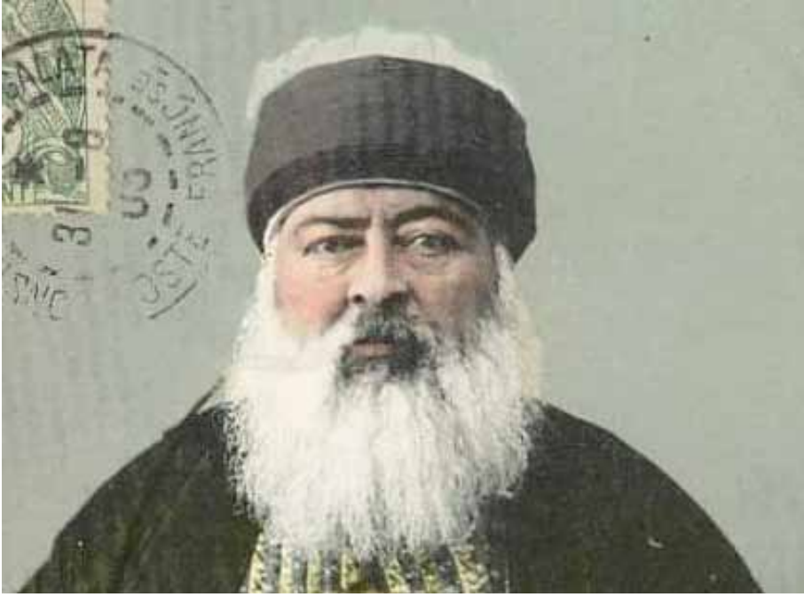
Resim 3. On İki Terkli Tâclı Nuri Baba

yasaklanıp tekkeleri kapatılmış, Bektaşiler takibata uğramıştı. Örneğin Hacı Bektaş Veli tekkesinde bulunan 26 dervişten sekizi sürgüne yollanmış, geride kalanların ise başlarından tâcları atılarak ve kendilerinden Nakşî tarikatı üzere olacakları sözü alınarak tekkede kalmalarına izin verilmişti (BOA, C.EV: 464/23489). Bu dönemde Bektaşilere ait mezar taşlarının tâc kısımlarının dahi kırıldığı rivayet edilmektedir (Ahmed Rıfki, 1327-II: 62). Cevdet Paşa'nın bildirdiğine göre bu dönemde Bektaşiler "Sünni kıyafetine girdiler ve meydanda Bektaşî kıyafetinde kimse kalmadı." (Ahmed Cevdet Paşa, 1309-XII: 183) Bazı Bektaşiler ise, on iki dilimli Bektaşî tâcı yerine dört dilimli tâc giyerek kendilerini gizlemeye çalıştılar (Hasluck, 1928: 49).