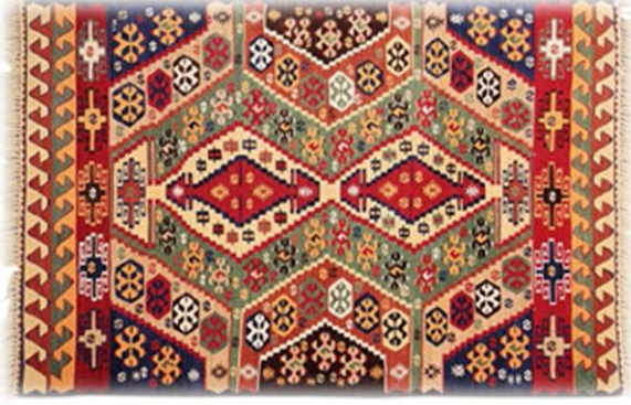
Bergama El Halısı