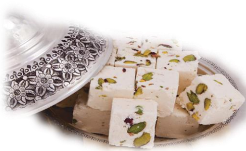
Kastamonu Çekme Helvası