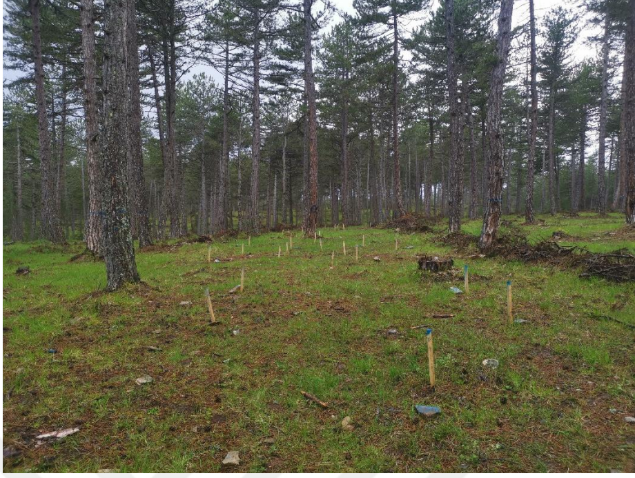
Şekil 3.4 Deneme desenine ait alan fotoğrafı