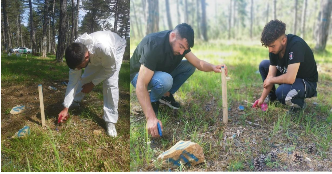
Şekil 3.2 Biyoorganik gübrelerin uygulama ve dozlarında spreyleme işlemleri