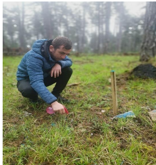
Şekil 3.5 Çalışma alanına ait fotoğraflar