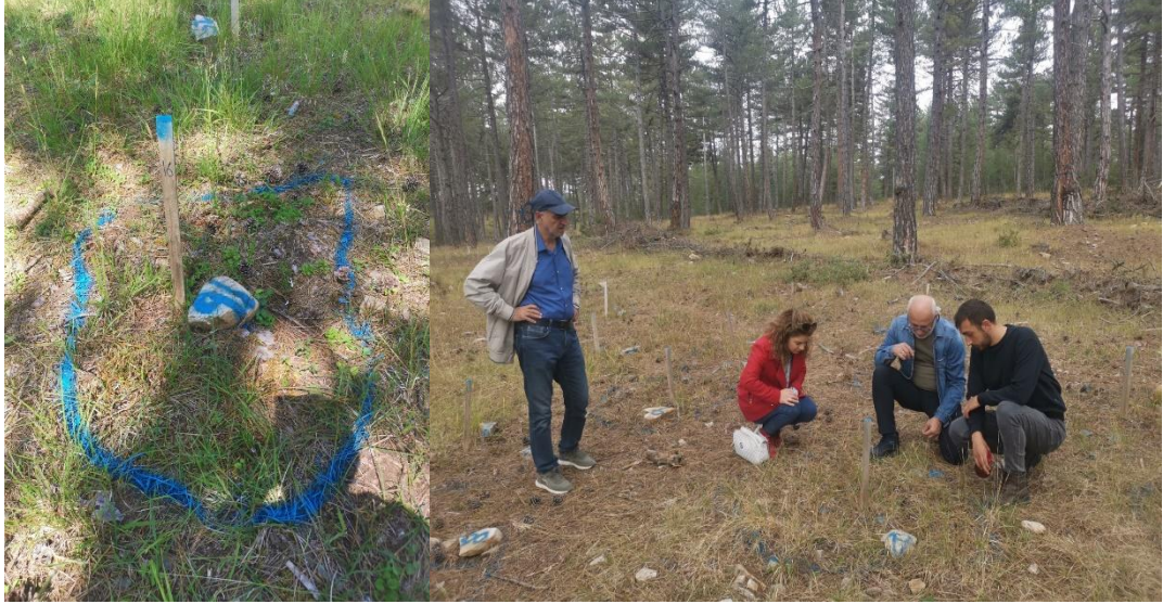
Şekil 3.3 Spreyleme işlemlerinden sonra fidanların işaretlenmesi ve uygulama denetimi