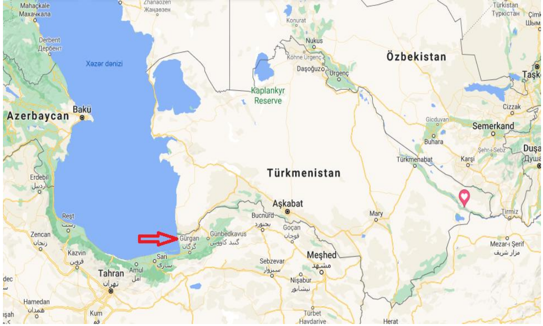
Ek 2- İran haritasında Gülistan Eyaleti'ne bağlı Gürgen şehri