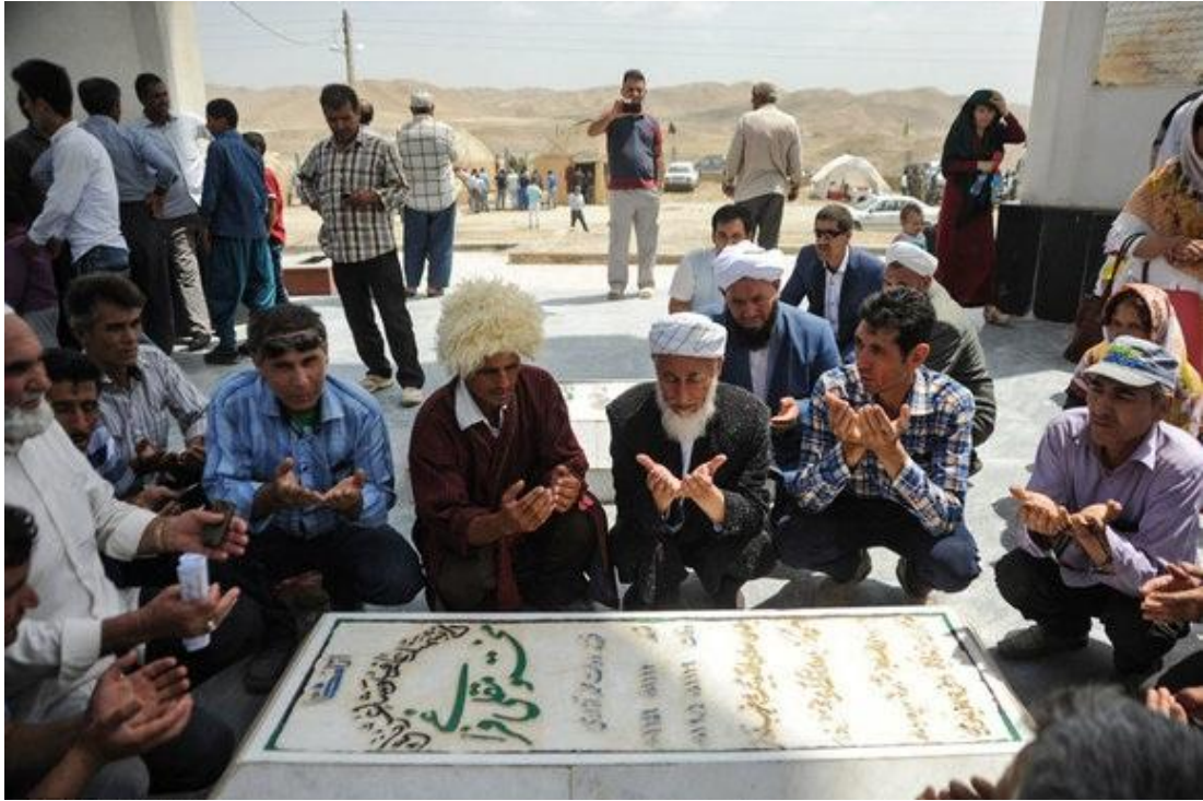
Ek 10- Mahtumkulu Firâkî (sağda) ve babası Devletmehmet Âzâdî'nin mezarı