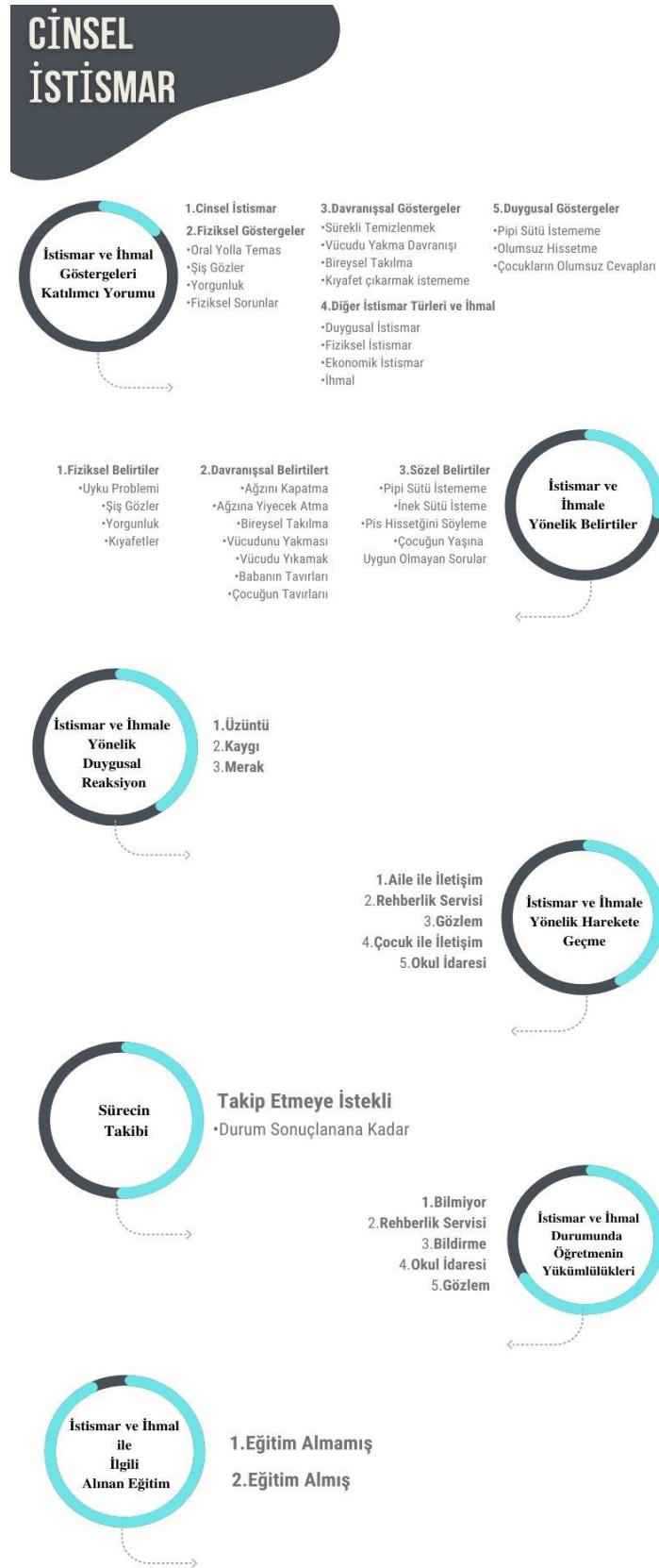
Şekil 4.1 Cinsel istismara ait temalar ve kodlar