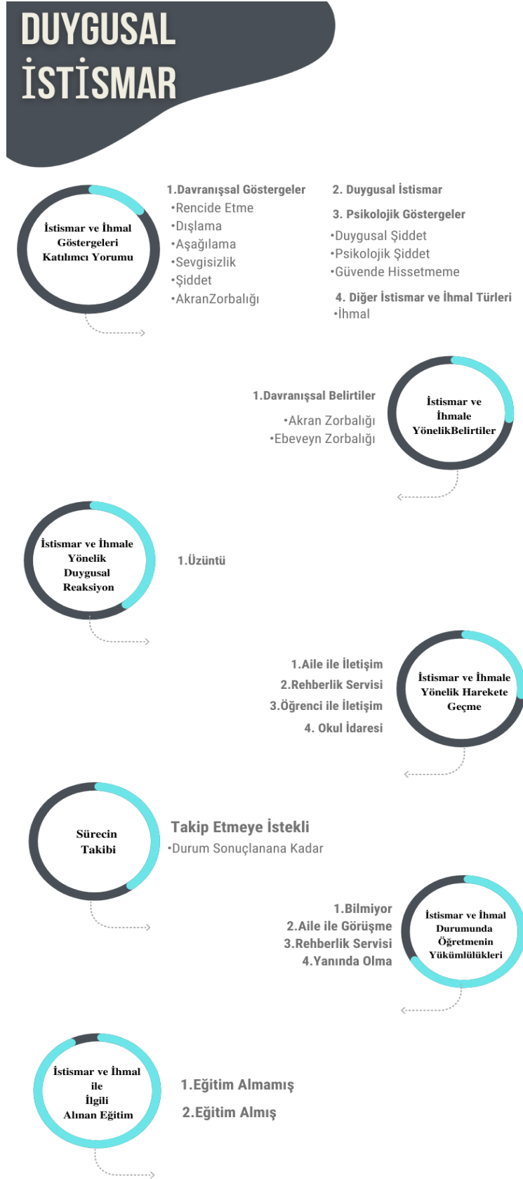
Şekil 4.3 Duygusal istismara ait temalar ve kodlar