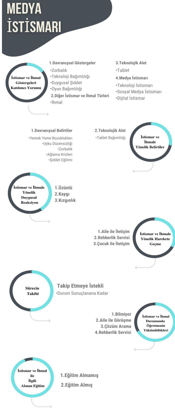
Şekil 4.5 Medya istismarına ait temalar ve kodlar