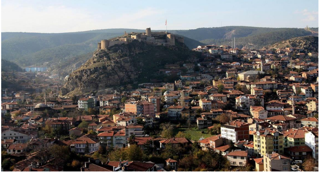
Resim 1. Kastamonu'dan bir görüntü ( http://www.manzara.gen.tr.com , 19.11.2018)