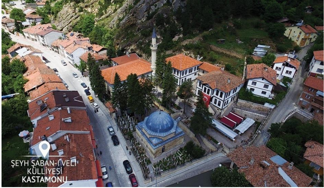
Resim 2. Hz. Pir Şeyh Şaban-ı Veli külliyesi