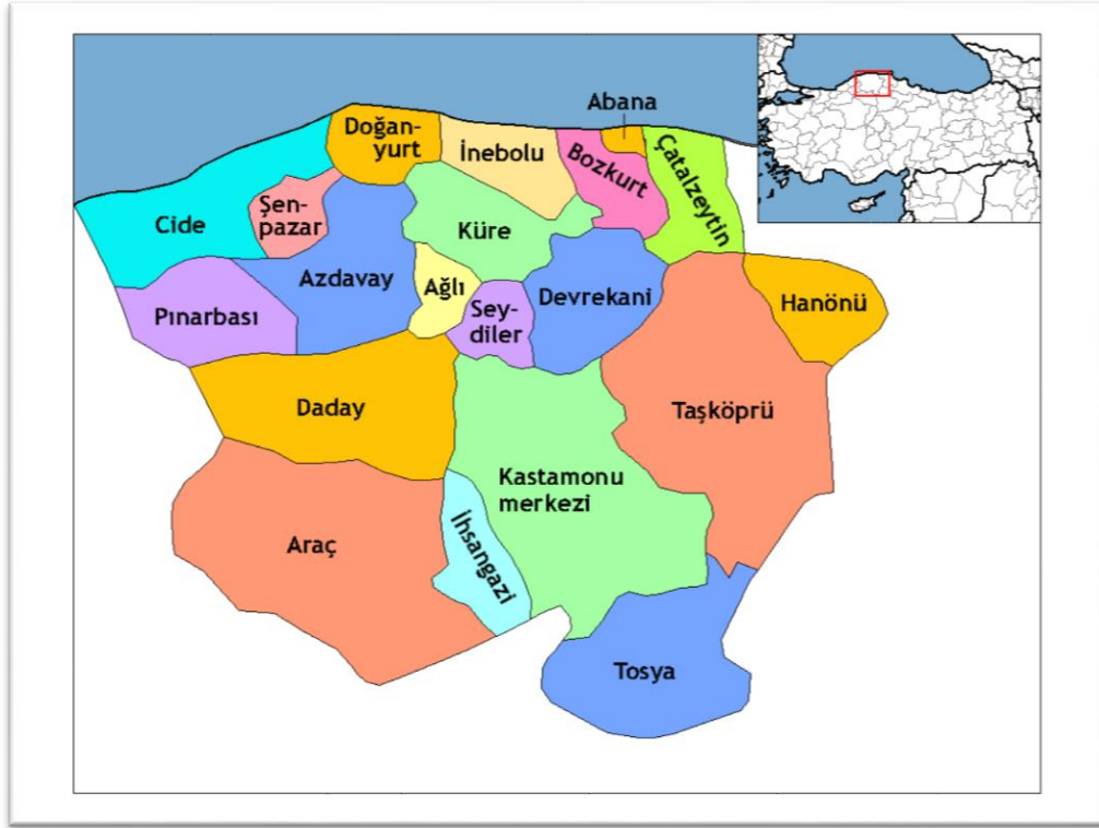
Şekil 2. Kastamonu ili ve ilçeleri ( http://www.wikizero.com , 15.10.2018)