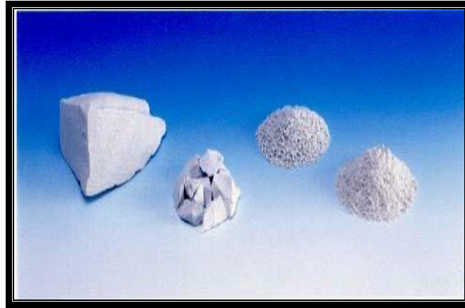
Şekil: 1 - Doğal Zeolit:Maden Cevheri ve Değişik Tane Boyutlu Ürünler (Anonim, 2001b)

Doğal zeolitlerin kullanımında; mineral tipi (Şekil 1), kimyasal yapısı (Tablo 2), iç yüzey alanı, boşluk hacmi ve boyutu, tane boyutu ve bunlara bağlı olarak katyon değişimi (Şekil 2) ve absorpsiyon kapasiteleri önemli özelliklerdir (Anonim, 2001a; Kocakuşak ve ark., 2001).