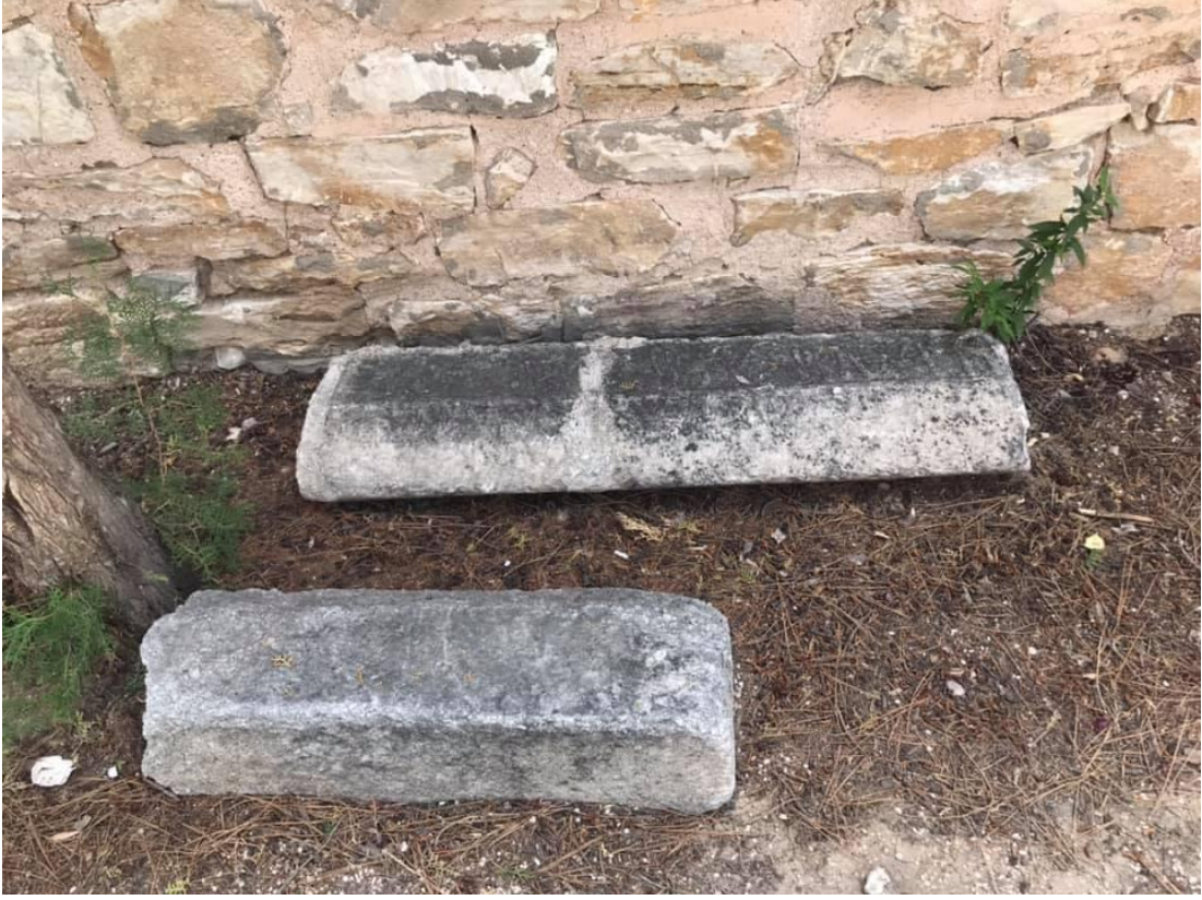
Resim 9: Âşık Paşa Türbesi Etrafında Bulunan Mezar Taşı-3