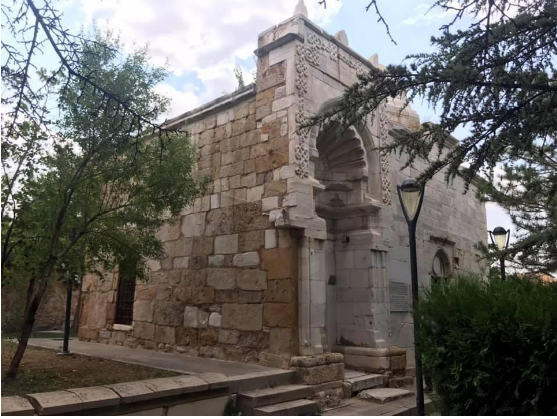
Resim 3: Âşık Paşa Türbesi-2