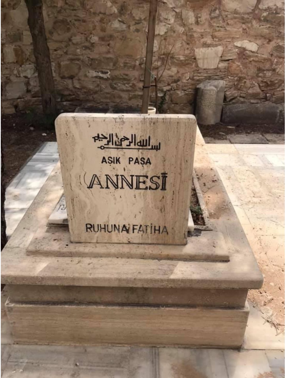
Resim 5: Âşık Paşa'nın Annesinin Kabri