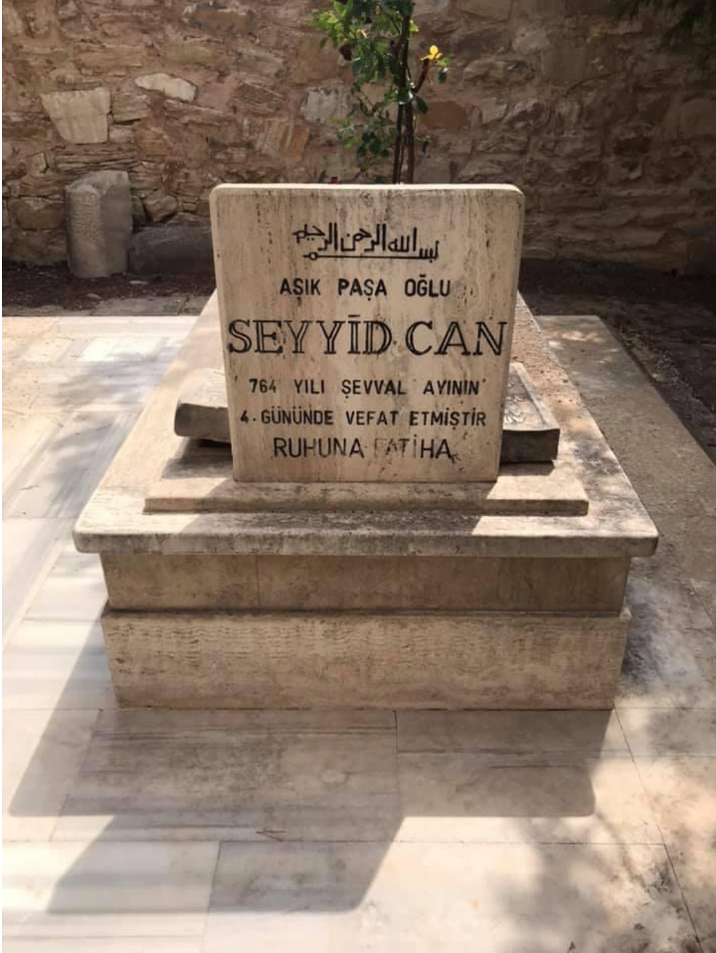
Resim 6: Âşık Paşa'nın Oğlunun Kabri