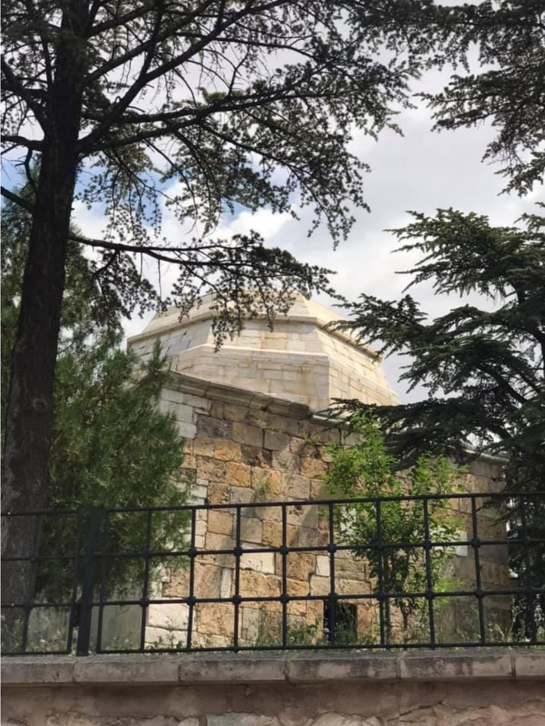
Resim 4: Âşık Paşa Türbesi-3