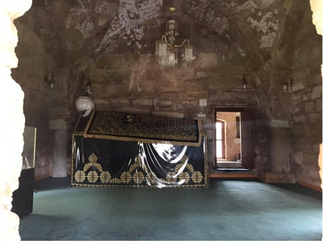
Resim 2: Âşık Paşa Türbesi-1