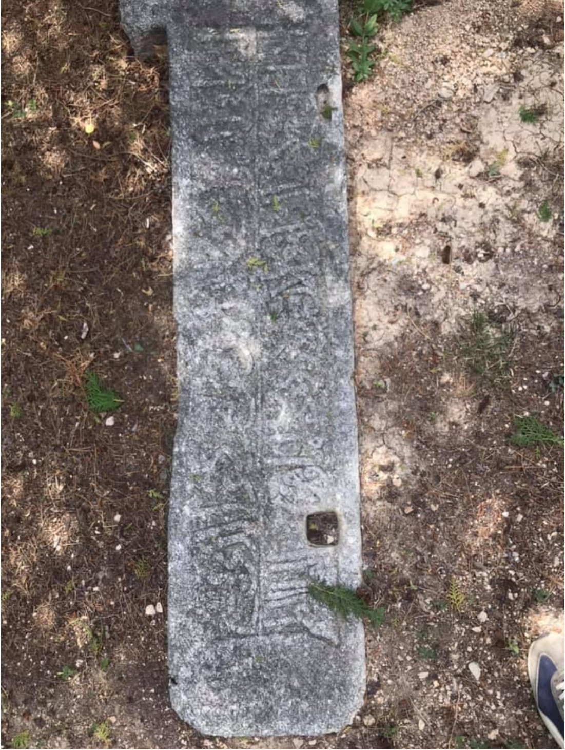
Resim 8: Âşık Paşa'nın Türbesinin Etrafında Bulunan Mezar Taşı-2