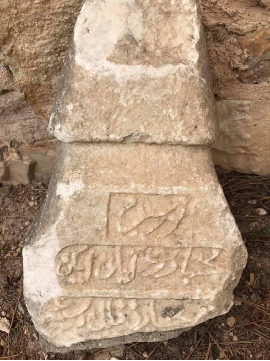
Resim 10: Âşık Paşa'nın Türbesinin Etrafında Bulunan Mezar Taşı-4