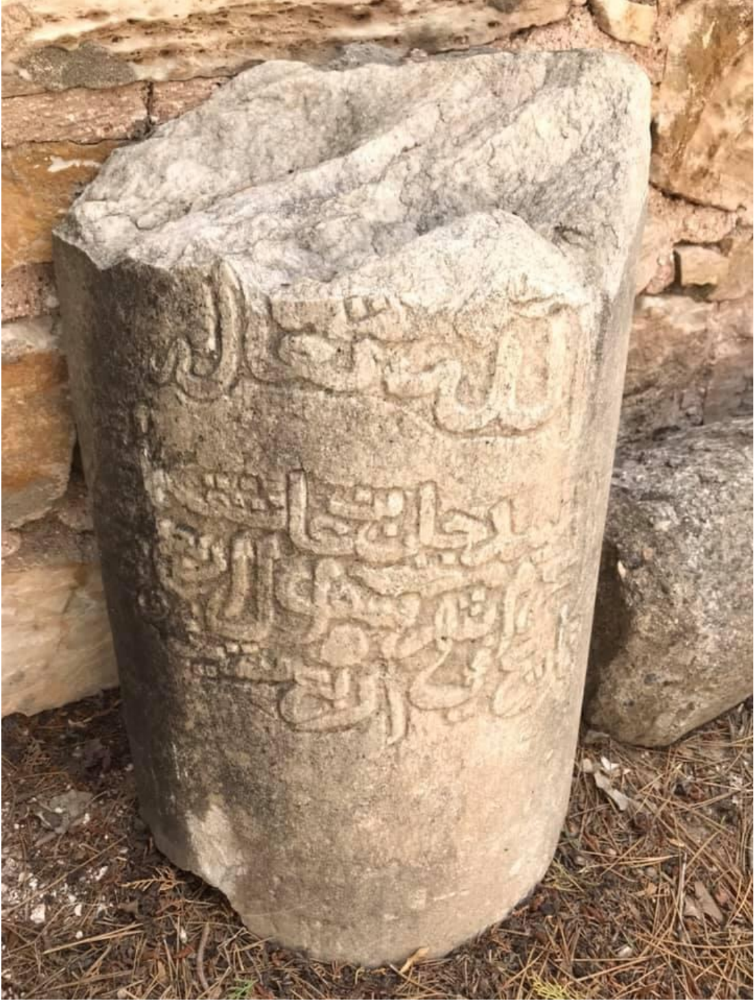
Resim 7: Âşık Paşa'nın Türbesinin Etrafında Bulunan Mezar Taşı-1