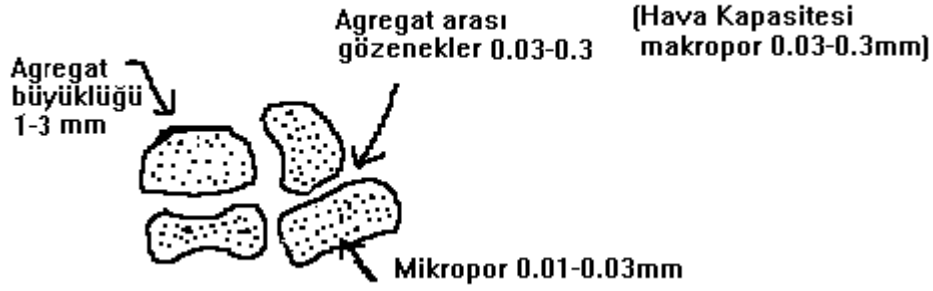
Şekil 1. İdeal Gözenek Boyutu Dağılımı

Bir yetiştirme ortamında optimal gelişme koşullarını sağlayabilmek için ortamın aynı anda % 20-25 hava hacmi ve % 20-30 kolaylıkla alınabilir su hacmine sahip olması arzu edilmektedir (Enbom, 1993).