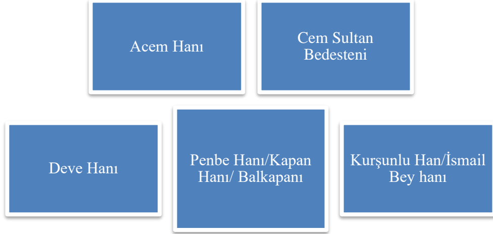
Şekil 3.1 Kastamonu’da bulunan bazı bedesten ve hanlar

Acem Hanı ; Akmeşcit mahallesinde ve Arabapazarında Gökdere caddesine doğru açılan köşede bulunan bu han, Koca Sinan Paşanın Kastamonu Sancakbeyi olduğu dönemde yaptırılmış olup Sinan Bey Camii adıyla anılan bu hanın tahrir defteri kaynaklarında kervansaray olduğundan bahsedilmektedir. Kervansaray ifadesinin altında 17 dükkan ibaresi vardır. Toplam 37 dükkan olduğu bilinen bu han 1952 senesinde bir şahsa satılmıştır.