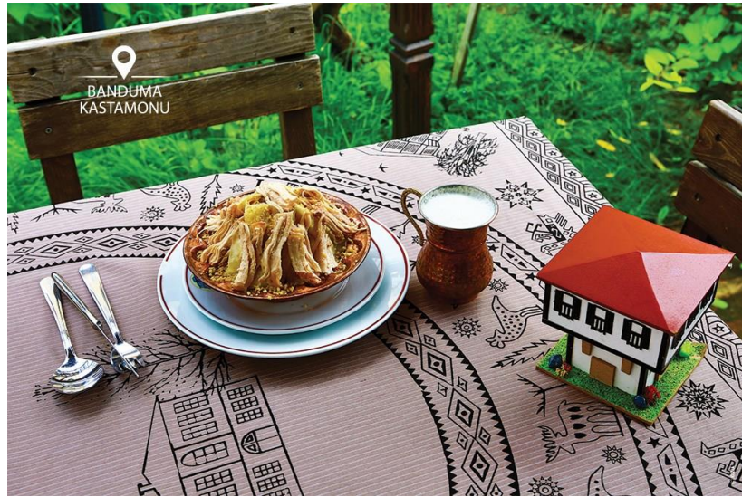
Görsel 3.9 Devrekani hindi banduması

Devrekani Hindi Banduması; Devrekani ilçesinde yetişen hindilerin pişirilmesi ile elde edilen hindi eti ve suyu, kuru yufka ve ceviz ile hazırlanan; pişirilmesi ve servis edilmesi gibi aşamalarla yöre ile özdeşleşmiş, bilgi ve ustalık gerektiren bir yemektir. Bu bağlamda ürünün tüm üretim aşamaları, belirtilen coğrafi sınırın içinde gerçekleşmektedir (URL17, 2024).