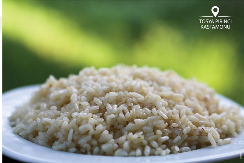
Görsel 3.4 Tosya pirinci

Türk Gıda Kodeksi Pirinç tebliğine göre orta taneli pirinç sınıfında yer alan Tosya pirinci, Sarıkılçık yerel çeşidini oluşturmaktadır. Yapı itibariyle kavuz ve kılçıkları kırmızımtırak koyu sarı renkte, kılçıklı ve uzun boylu, yatmaya dayanıklılığı iyi, verimliliği ise orta durumdadır. Ayırt edici özelliklerine bakıldığında, kar sularının erimesi ile oluşan Devrez çayının suyuyla sulanması, kar suyunun vermiş olduğu aroma olarak söylenebilir. Yetiştigi su minimum 12 maksimum 24 derece sıcaklıkta olan devrez suyudur. Tosya pirincinin başka yörede yetişmiyor olmasının en temel sebebi ise bölgede ki nispi nem değerinin düşük olmasının çeltikte fungal hastalıklar görülmesini engelliyor olmasıdır (URL17, 2024).