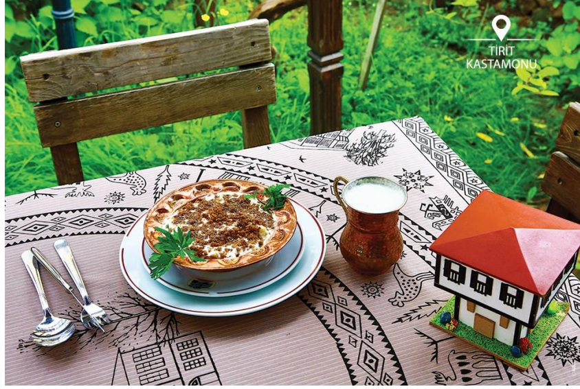
Görsel 3.10 Kastamonu tiridi/Kastamonu simit tiridi