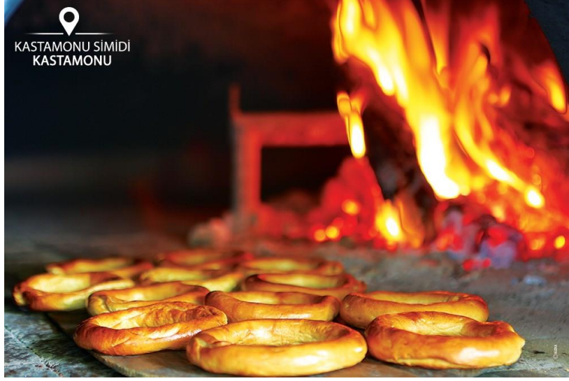
Görsel 3.8 Kastamonu simidi