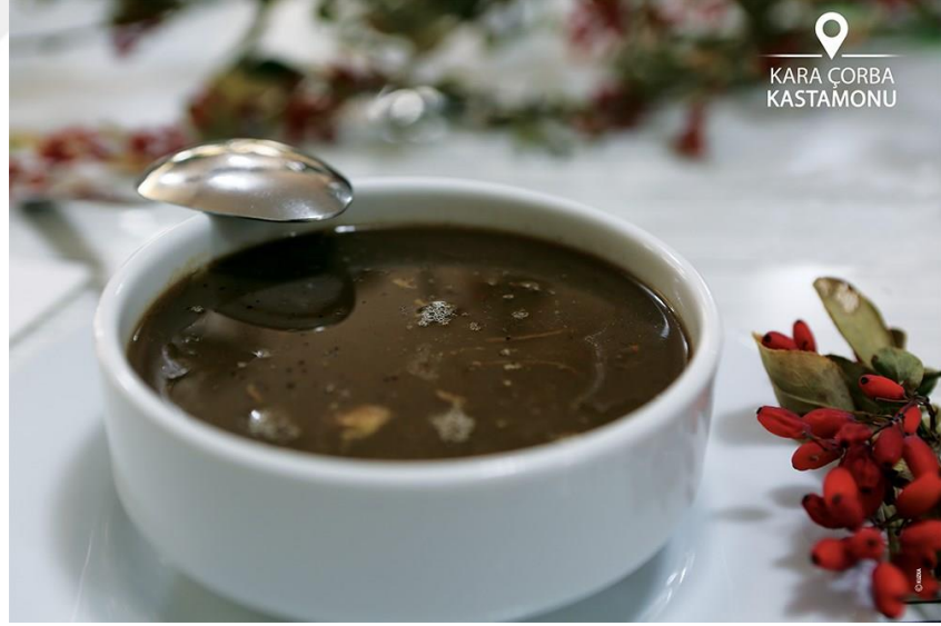
Görsel 3.5 Pınarbaşı kara çorba

Bir bütün tavuk yaklaşık 100 gr olan bir adet soğan, 8 gr tuz, 2 litre su ve 5 gr karabiber ile haşlanır. Elde edilen tavuk suyu, kara çorbanın suyu olacak şekilde ayrılır. 2 litre tavuk suyuna 10-15 ml kızamık ekşisi eklenir. 20 gram un, 500 ml soğuk su ile karıştırılarak meyane yapılır ve kaynayan tavuk suyuna karıştırılarak eklenir. Çorba 5 dakika kaynatılır. Haşlanan tavuktan 100-150 gram tavuk eti ayrılır, 100 gr tereyağı 5 gram karabiber ve 8 gram tuz ile harmanlanarak kızartılır. Pişen çorbaya tavuk eti eklenerek servis edilir. Çorbanın yapımında kullanılan kızamık ekşisinin Pınarbaşı ilçesi ve köylerinde üretilmesi gerekmektedir (URL17, 2024).