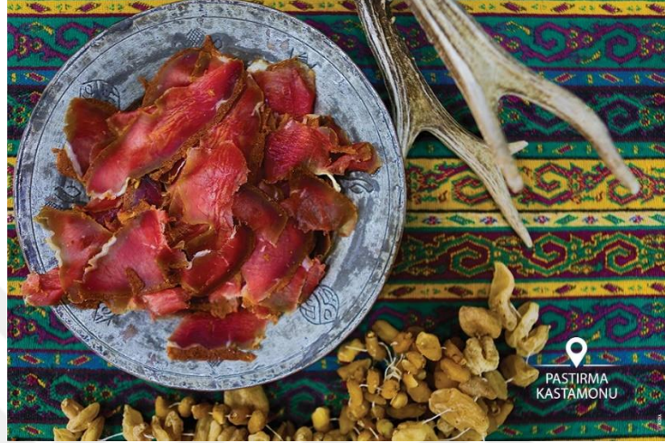
Görsel 3.11 Kastamonu pastırması

keskin bir bıçak yardımı ile elle ince kesilmesi işleminin ustalık gerektiren bir işlem oluşu gibi özellikler sayesinde Kastamonu ile ünlenmiştir. Bu bağlamda bahsi geçen tüm işlem basamaklarının belirtilen coğrafi sınır içinde gerçekleşmesi gerekmektedir (URL17, 2024).