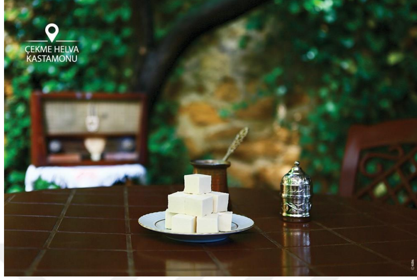
Görsel 3.7 Kastamonu çekme helva