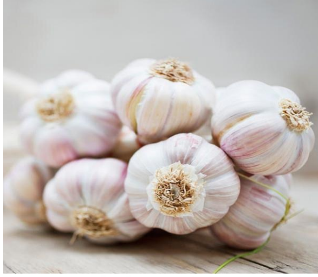
Görsel 3.2 Taşköprü sarımsağı