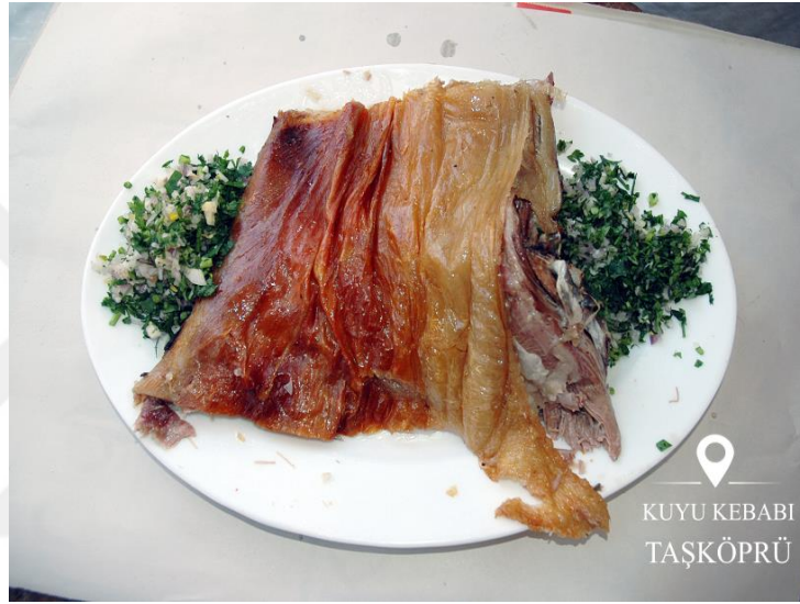
Grsel 3.3 Tařkpr kuyu kebabı

Kastamonu ve Denizli illerinde ‘‘Kuyu Kebabı’’ olarak bilinen bu lezzet, İzmir blgesinde ‘‘Tak tak kebabı’’, Siirt ve Bitlis’te ise ‘‘Bryan’’ olarak bilinmektedir (Anonim 2, 2022, akt. Ayyıldız, Trker, Pınarođlu, 2023).