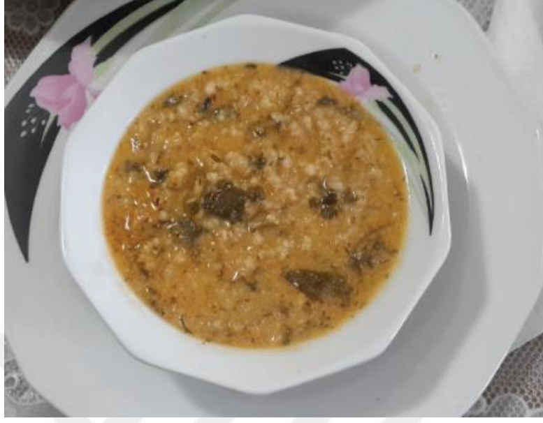
Görsel 3.12 İhsangazi ekşili pilavı