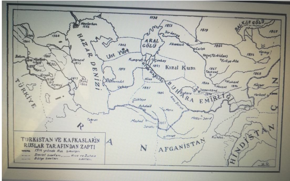
Ek-2 Türkistan ve Kafkasların Ruslar tarafından zaptı Akdes Nimet Kurat,Rusya Tarihi Başlanğıçtan 1917'ye Kadar