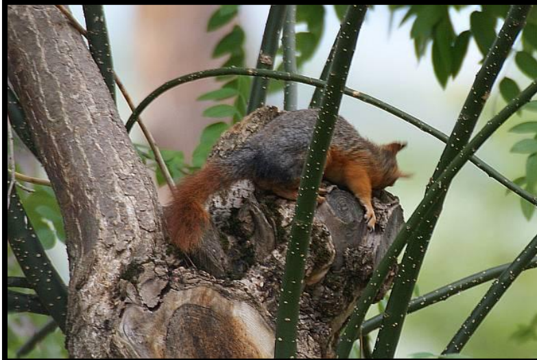
Şekil 4. S.anomalus ’un gövdeyi kemirirken çekilmiş görüntüsü

Ağaç sincapları kurak geçen yaz aylarında ağaçların gövdelerini ve dallarını kemirip kabuklarını, ufak alanlar halinde veya halka şeklinde soyabilmektedirler. Sincaplar, kabuğunu soydukları ağaçlarını kambiyum ve odun kısımlarını yerler ve ağacın öz suyunu yalarlar (Şekil 4). Kabuğu soyulan ağaçlar zayıflar, kabuk böceklerinin salgınlarına ve çeşitli hastalıklara açık hale gelir. Bunun sonucunda da ağaçlarda kuruma problemleri ortaya çıkmaktadır. Anadolu ağaç sincaplarının çam, kayın, ladin, meşe, huş ve göknar ağaçlarını soydukları literatürde belirtilmektedir (Klemm 1958).