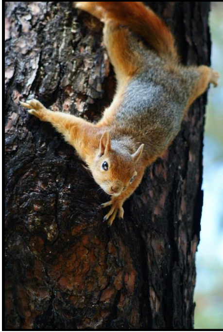
Şekil 5. S.anomalus 'un ağaca tırmanma esnasındaki görüntüsü

Sincaplar tırnaklarını kullanarak ağaçlara çok iyi tırmanır (Şekil 5). Ağaçlar arasında dallardan dallara atlayarak gezerler. Sincaplar besinlerini yemek için ön ayaklarını el gibi kullanırlar, meyveyi tutarlar ve dişleri ile kemirerek yerler (Şekil 6).