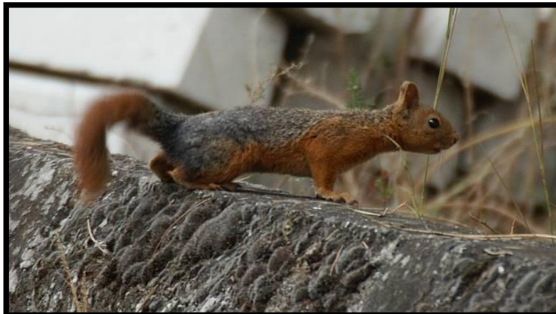
Şekil 4. Sciurus anomalus ’un görünümü

Çalışma alanımızdaki gözlemlerimizde alanda bulunduğu belirlenen Sciurus anomalus ’un kırmızımsı kahverengi renkte olduğu tespit edilmiştir (Şekil 4).