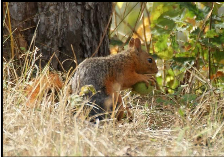
Şekil 6. S.anomalus 'un beslenme anındaki görüntüsü

Albayrak ve arkadaşları (2005)'na göre meyve olarak tercihleri meşe ( Quercus spp. ), boylu ardıç ( Juniperus excelsa ), ceviz ( Juglans regia ), karaçam ( Pinus nigra ), ak söğüt ( Salix alba ), ahlat ( Pyrus elaeagnifolia ), alıç ( Crateagus monogyna ), armut ( Pyrus domestica ), elma ( Pyrus malus ) ve kuşburnu ( Rosa canina )'ndan oluşmaktadır.