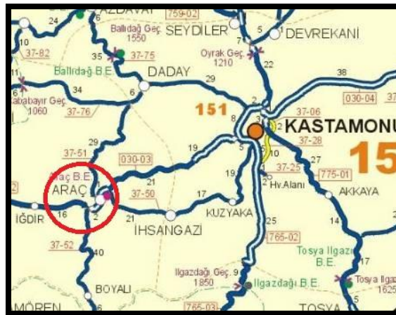
Şekil 1. Araç İlçesinin Türkiye Haritasındaki Konumu (URL1)

Araştırma alanını Kastamonu-Araç Merkez Orman İşletme Şefliği (41° 12' 36" ile 41° 20' 55" kuzey enlem - 33° 15' 50" ile 33° 31' 10" doğu boylamı) ormanları oluşturmaktadır. Alanın denizden yüksekliği 605 m ile 1416 m arasında değişmektedir. Çalışma alanının da içinde bulunduğu Araç İlçesi Karadeniz bölgesinin Batı Karadeniz bölümünde Karabük iline bağlı Safranbolu ilçesi ile Kastamonu arasında kurulmuştur. Doğusunda Kastamonu ve İhsangazi, batısında Safranbolu, kuzeyinde Daday, güneyinde Kurşunlu ve Çerkeş ilçeleri bulunur (Şekil 1). Rakımı 641'dir. Yüz ölçümü 1878 km 2 'dir.