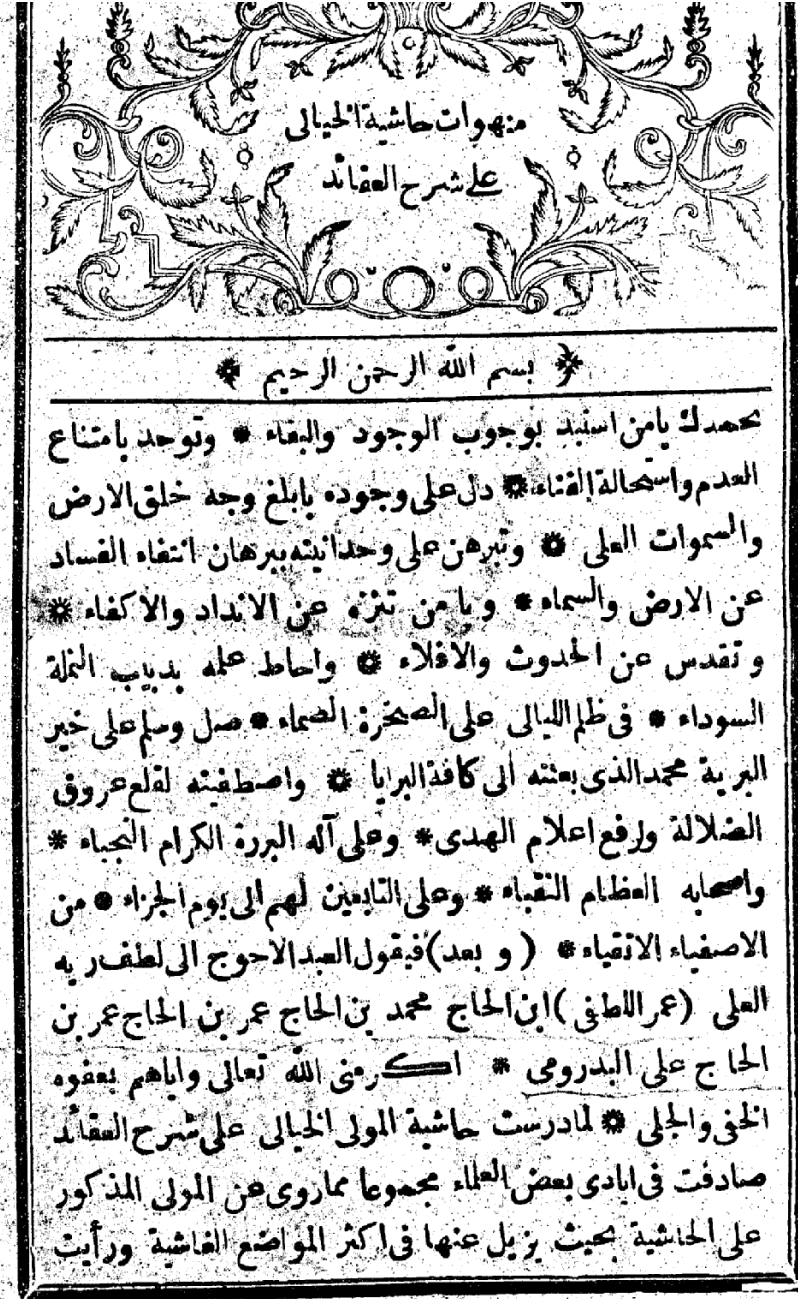
Ek 4. Şeyhülislam Ömer Lütfi Efendi'nin Maaş Miktarlarını Gösterir Çizelge ( BOA, Y.MTV, 66/92)