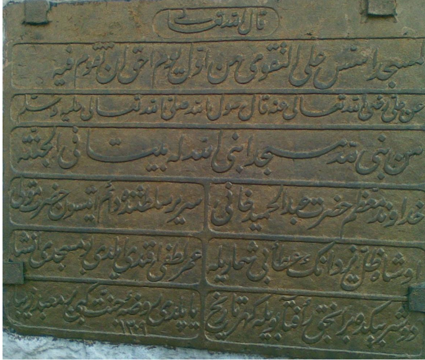
Ek 5. Şeyhülislam Ömer Lütfi Efendi Mescidi ve Şahidesi